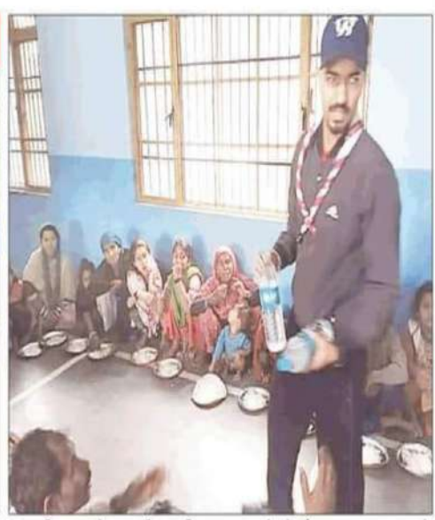
कुल्लू : कुल्लू जिला में प्राकृतिक आपदा से जनजीवन अस्त-व्यस्त हो चुका है। इसी को लेकर भारत स्कान्जट्स एवं गाइड्स हिमाचल प्रदेश राजकीय महाविद्यालय कुल्लू के रोवर्स लगातार कुल्लू शहर के आसपास के विस्थापित लोगों की मदद में जुटे हुए हैं। इसी दौरान रोवर्स खाना ले जाते हुए व खाना खिलाते हुए।