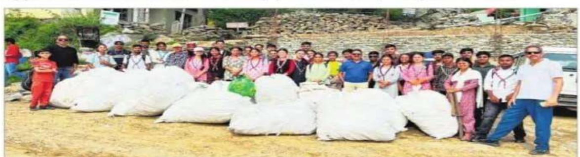
Rotarians, and Rovers and Rangers with the accumulated garbage in Kullu on Monday.

He said a concrete waste management plant needed to be developed and implemented for all civic bodies and panchavats of the state.